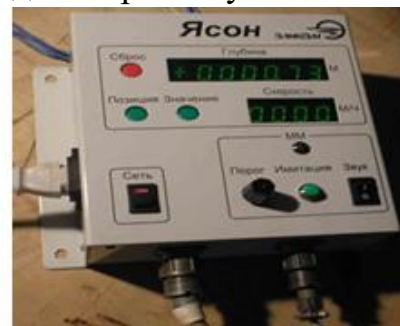
Рис. 3 Наземная регистрирующая аппаратура для ПРК-4203